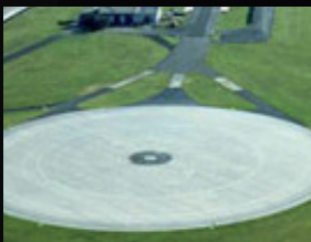
Plate-forme circulaire d'adhérence transversale, sol mouillé