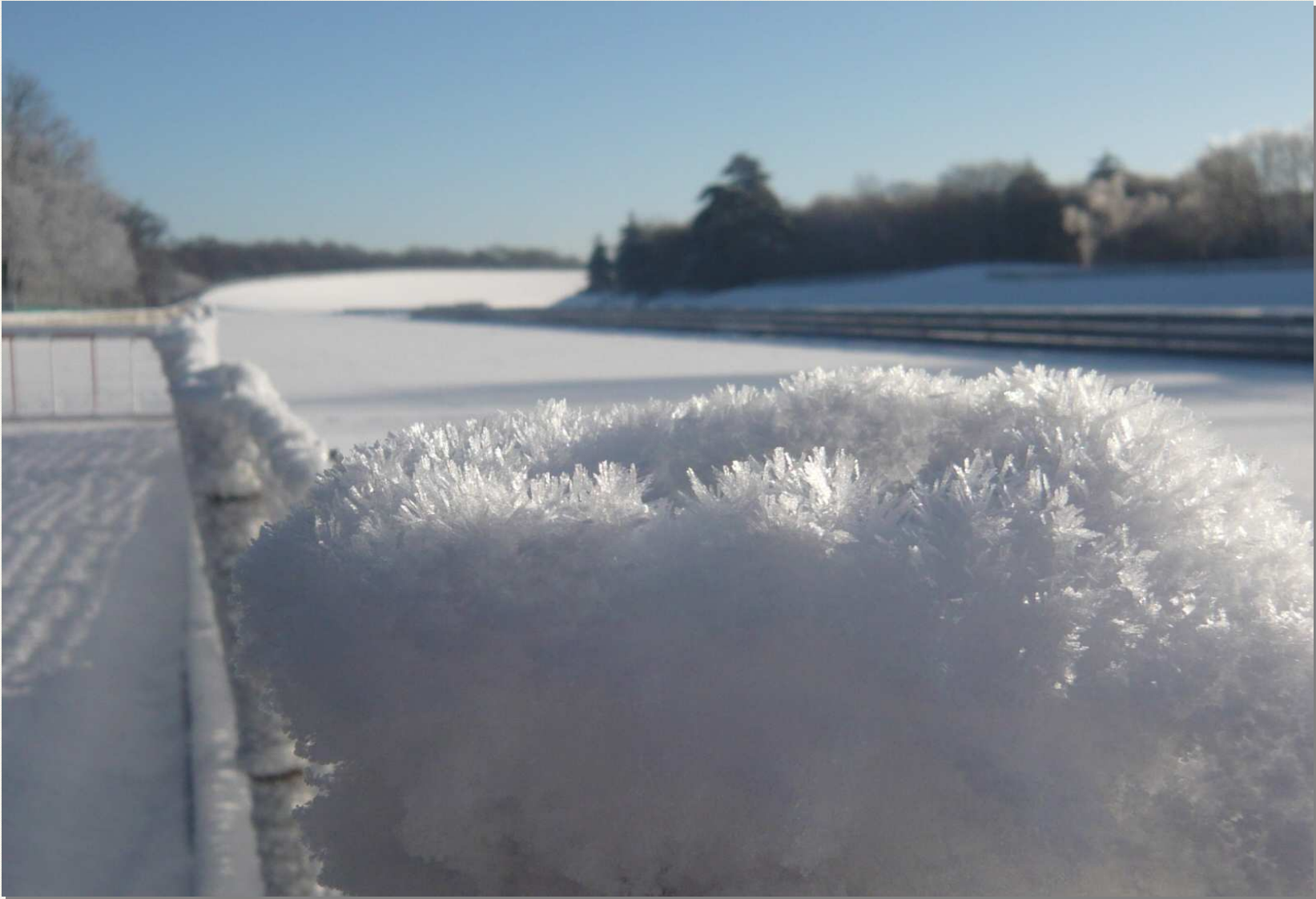
Raccordement chicane Nord – 10h43