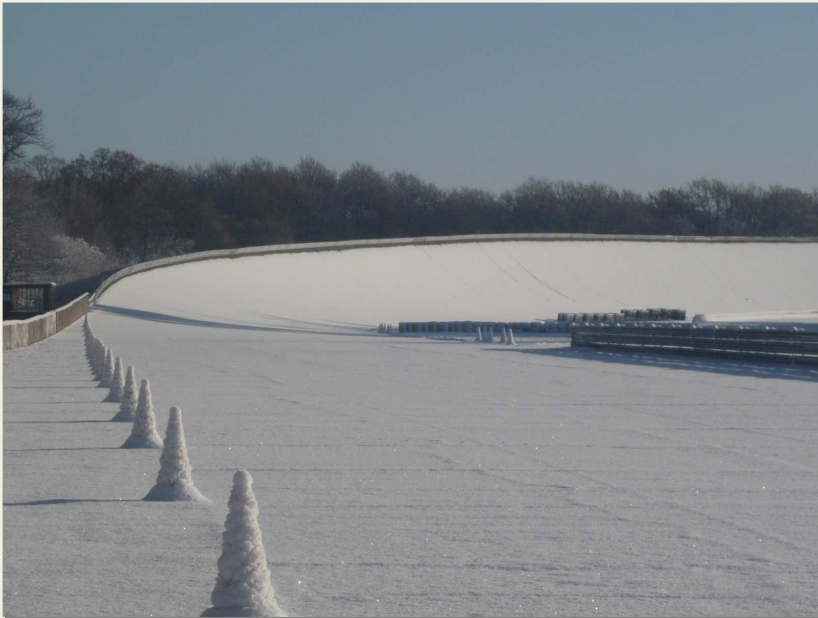
Entrée en piste – 10h45