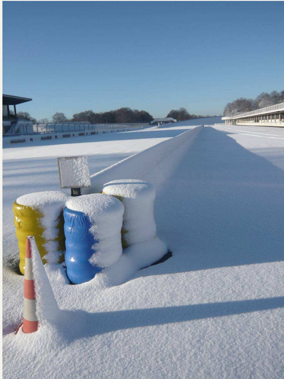
Pit-Lane – 10h55