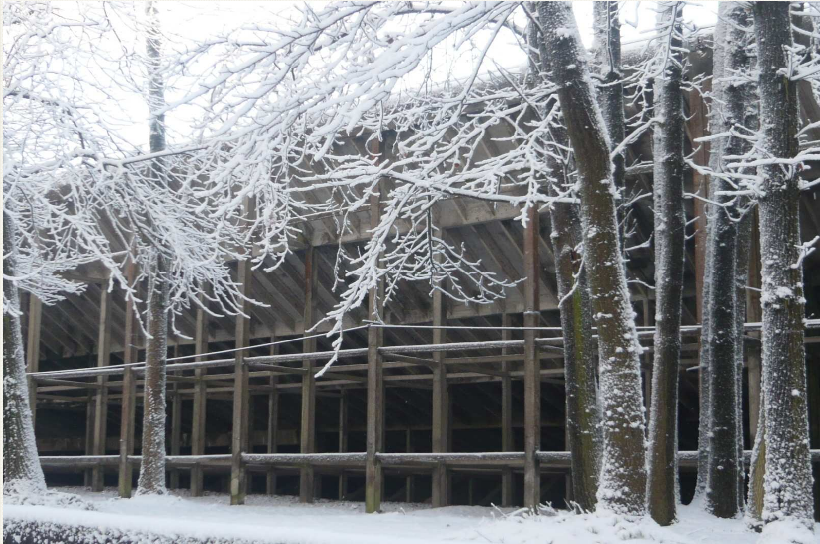
Arrière du banking – 11h01