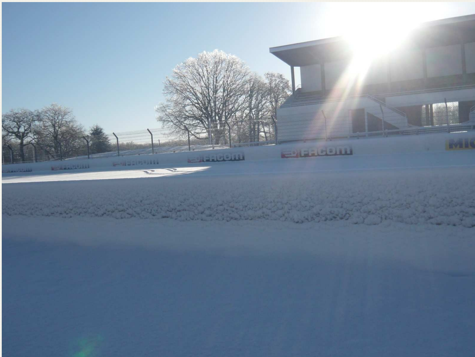
Ligne droite des stands – 10h53