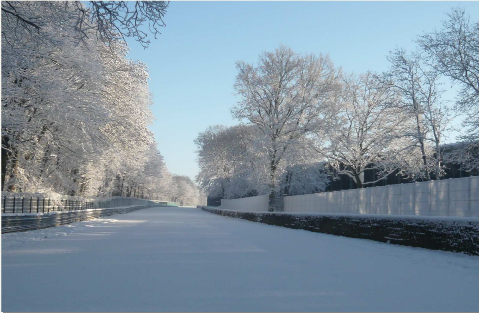
Ferme Faye – 10h59