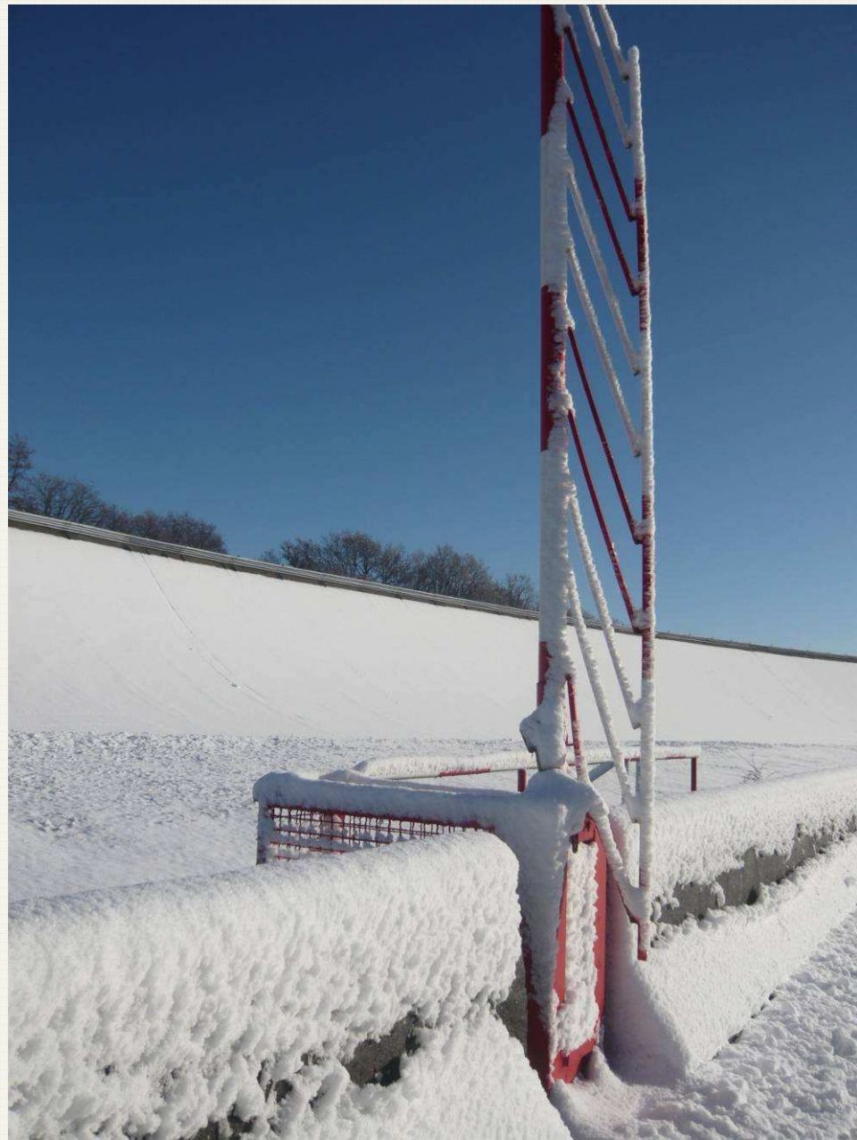
Barrière Piste Basse adhérence – 10h48