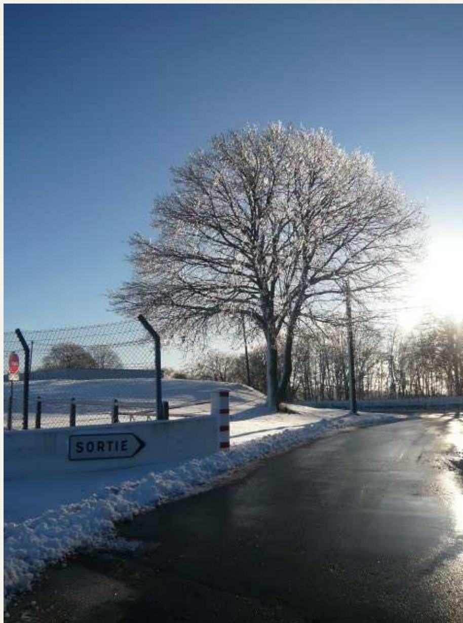
Goulet Sud – 11h03