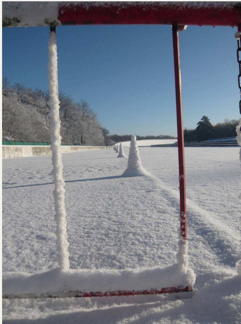
Barrière chicane Nord – 10h44